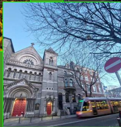
St. Ann's Church