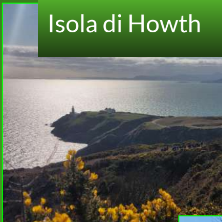
Isola di Howth