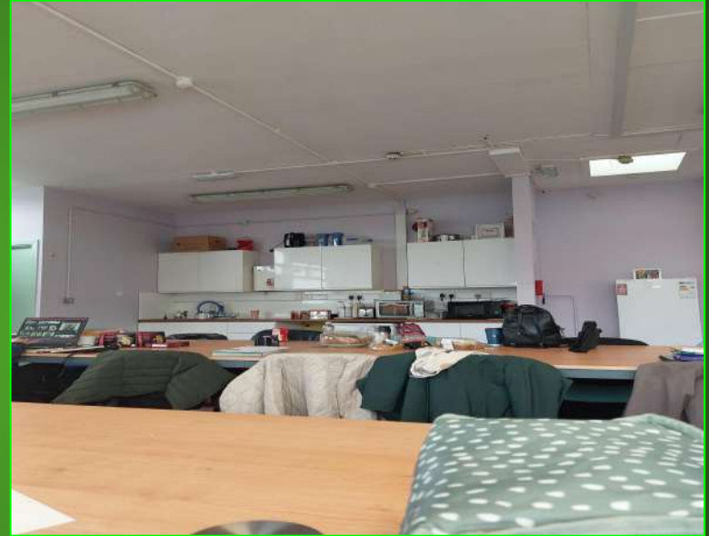
aula docenti con cucina (staff room) Ellenfield community college.